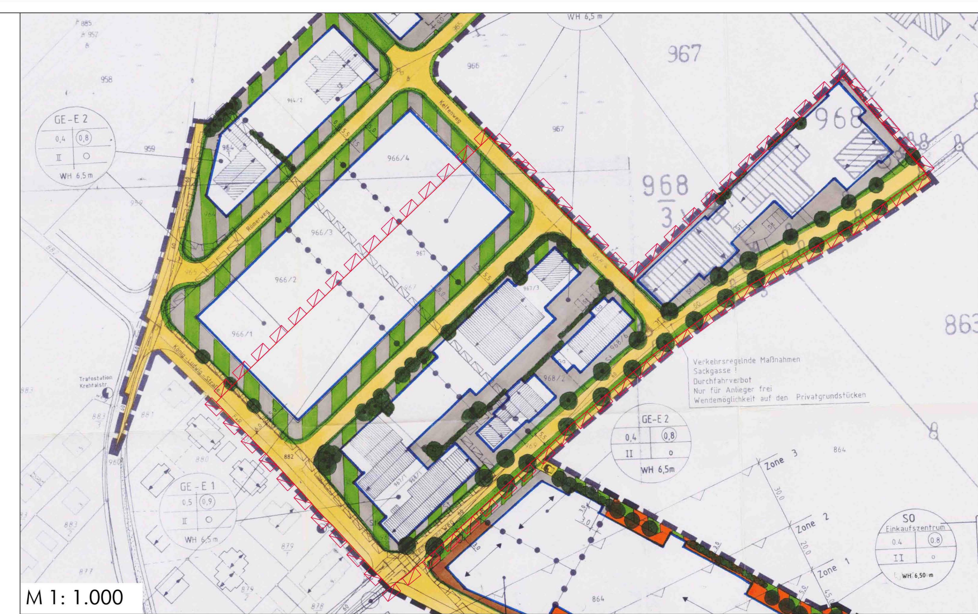
Neuaufstellung des Bebauungsplanes Nr. S5 "Gewerbegebiet zwischen B17 Münchener Straße und Krehtalweg/Keltenweg" (Fassung vom 07.07.1997, rechtsverbindlich seit 30.03.1998)